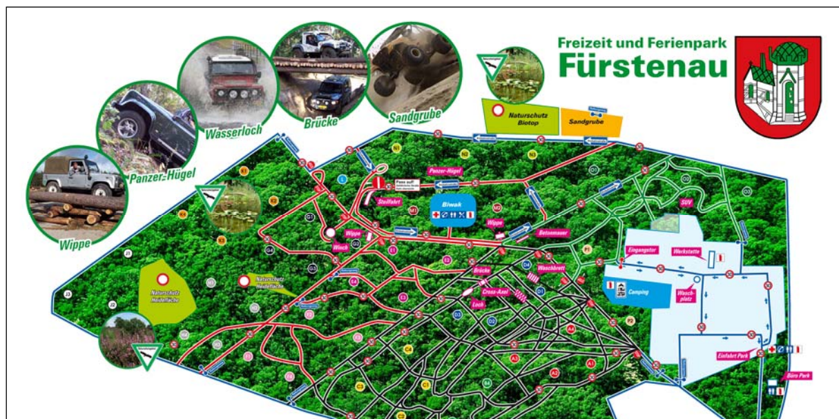
Streckenplan des 4x4-Geländeparks

Parallel zur Beantragung wurde eine Schalluntersuchung durchgeführt und zwischen den alten Schießbahnen der Kaserne ein Campingplatz eingerichtet.