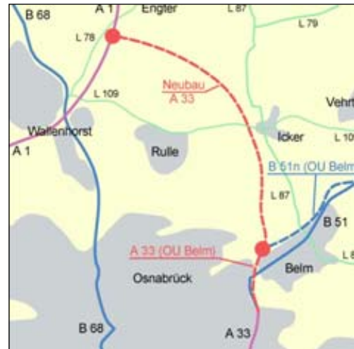
Übersichtsplan Neubau A 33

Projekt: Neubau der A 33 (Lückenschluss A 33-Nord) Auftraggeber: Hansa Luftbild/Nieders. Landes- behörde für Straßenbau und Verkehr Zeitraum: 2009 Ansprechpartner: Herr Runge 0251 23 30 235 Herr Schemme 0541 503 793