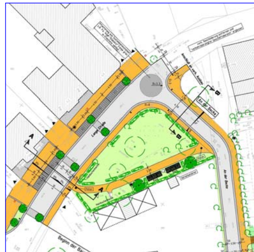
Auszug aus Lageplan