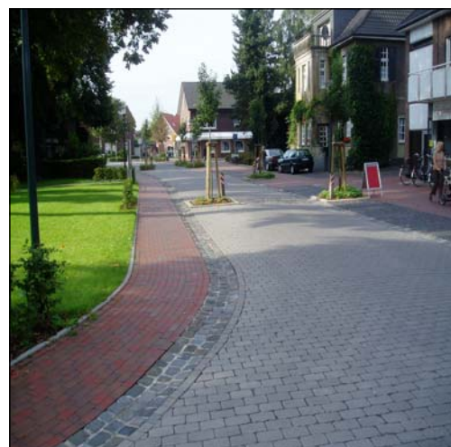
Ausbau nach Fertigstellung